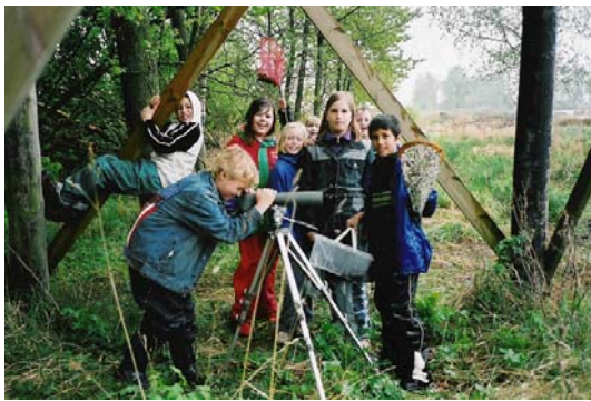
En sångsvan ute på ängen...