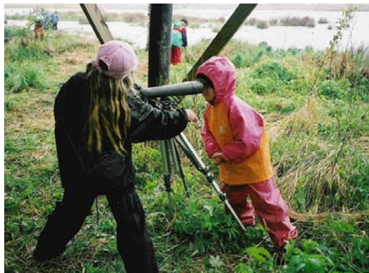
Nej, inte så!