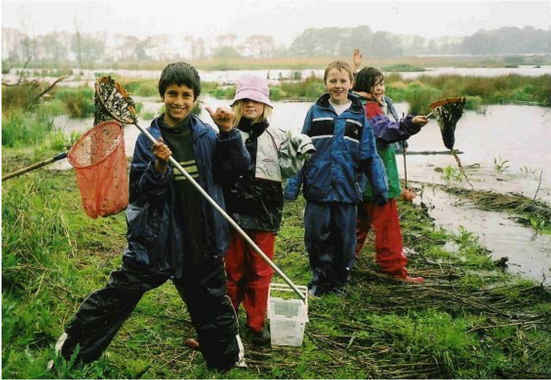
Vi har hittat en liten vattensalamander, nattsländelarver och dykare!