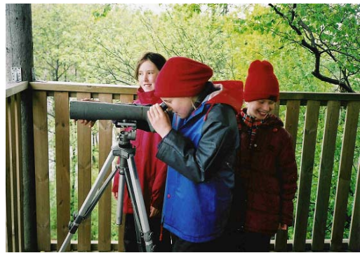
Där är gråhakedoppingen som häckar!