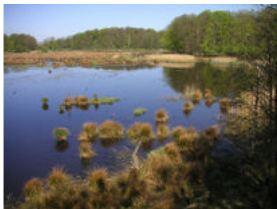
Utsikt från fågeltornet. Bulls måse.

Projektet hoppas kunna fortsätta under våren 2009.