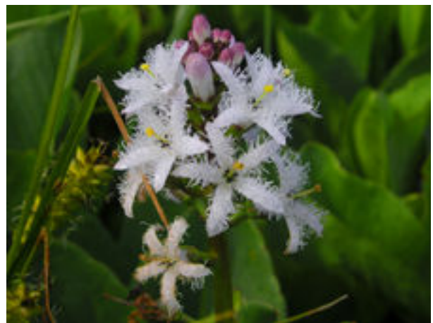
Vattenklöver - användes förr som nödföda.