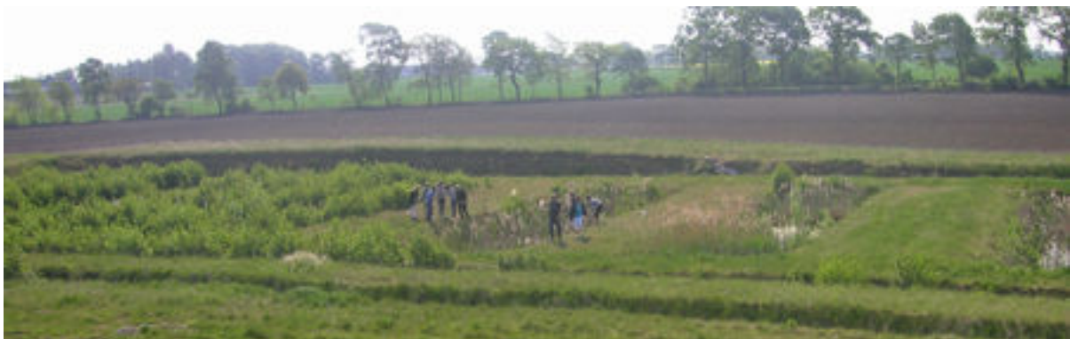
Några av dammarna sedda uppifrån informationshuset Naturpunkten.