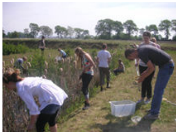
Fler djur i damm 12 än i bäcken!