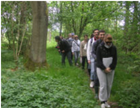
Intensivt fågelkvitter i skogen!

Vid inbokningarna till Bulls måse och Långeberga i början av terminen tackade ca 1/3 av de inbjudna skolorna ja till att komma ut. Majoriteten av de övriga tackar nej, eftersom skolan inte ställer upp med transportkostnad. Långeberga underlättar åtminstone för de som bor i Helsingborg.