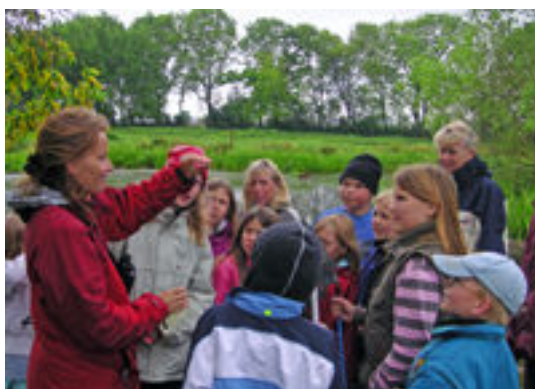
En dammsnäcka – den är både hona och hane samtidigt!

Grupperna har fått en inblick i hur landskapet har förändrats när det gäller våtmarker, bäckar och åar i Skåne och vad förändringarna har haft för effekt för vattenkvalitet, djur och växter, samt vad man gör nu för att förbättra situationen. I Bulls måse har eleverna gruppvis fått titta på fåglar från fågeltornet och håva vattendjur i våtmarken. Vi har pratat om vad vi har hittat och om hur djuren lever - vart fåglarna flyttar på vintern, hur mycket en svala väger, vad en buksimmare äter mm. Presentationen har gjorts så intressant som möjligt med många roliga fakta. Vi har pratat om ekologi, näringskedjor och om miljömålen. De äldre eleverna har ibland gjort en övning gruppvis där de diskuterat utifrån bilder på gödsling, regn, våtmark, algblomning, mm. Eleverna har fått med sig broschyren "Råån och miljön" och de äldre klasserna Länsstyrelsens årsrapport från 2005 med tema "Skånes vatten - levande, myllrande och i balans". Har tid funnits har vi även gjort en näringskedjelek, med inplastade bilder på djur och växter från Bulls måse.