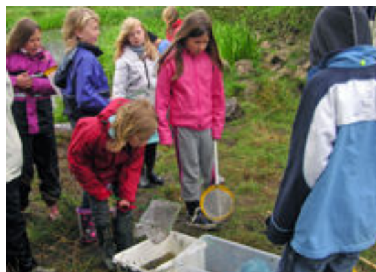
Vi har hittat en liten vatten-salamander och, en gulbrämrad dykare.