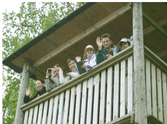
Vi har sett den bruna kärrhöken!