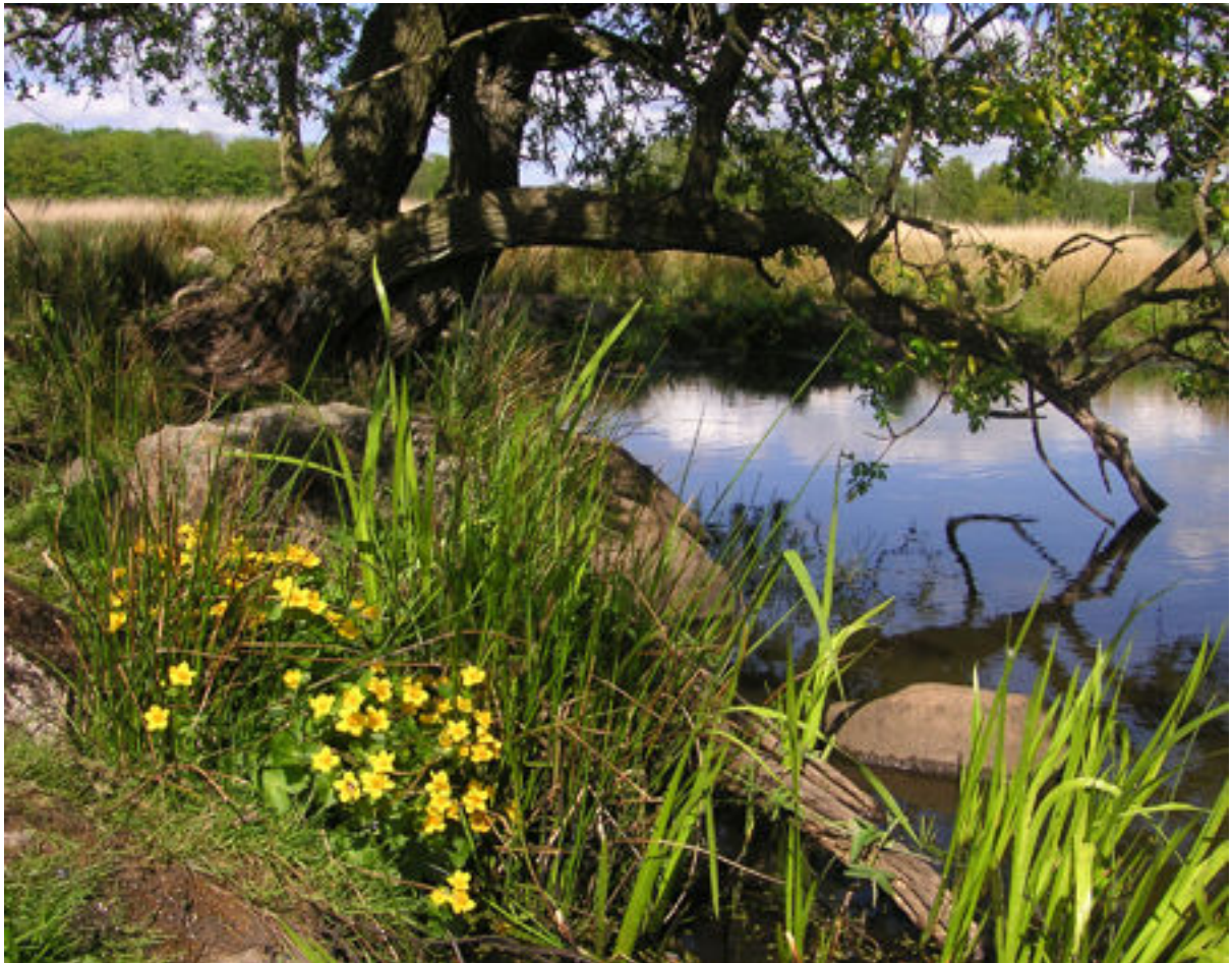
Blommande kabbeleka, sälg och vattenklöver i maj.